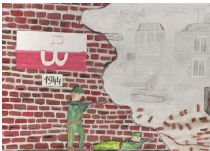
Ksawery Buż - kl. 6a